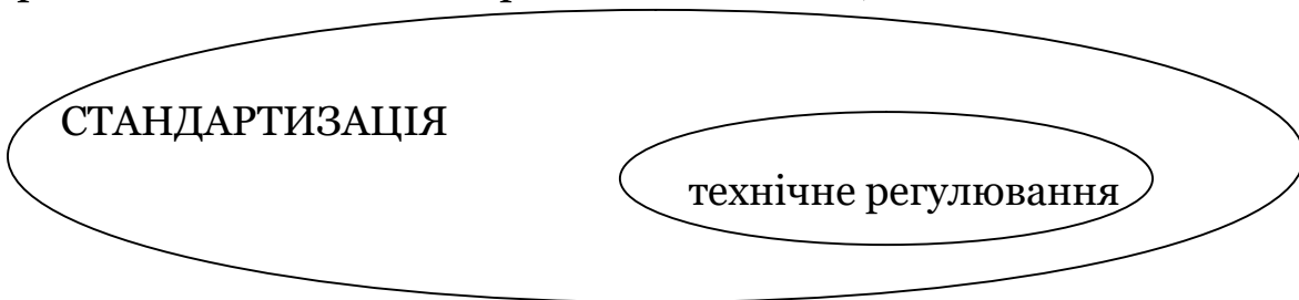
Схема 2. Співвідношення стандартизації та технічного регулювання

європейці розуміють як акти регулювання. Вбачається, що дослівний переклад «technical regulation» як «технічне регулювання» призвів до помилкового розуміння, що в Європі діє система технічного регулювання поряд із стандартизацією. На офіційній сторінці CEN роз'яснюється різниця між стандартизацією та законодавством. Стандарти розробляються через процес співпраці зацікавлених сторін, затверджуються та публікуються визнаними органами стандартизації. Положення та інші види актів законодавства приймаються урядами на національному або регіональному рівні або наднаціональними та/або міждержавними організаціями, такими як ЄС. Крім того, використання стандартів є добровільним, тоді як норми є обов'язковими та юридично закріпленими. Тобто стандартизація не така ж, як законодавство.