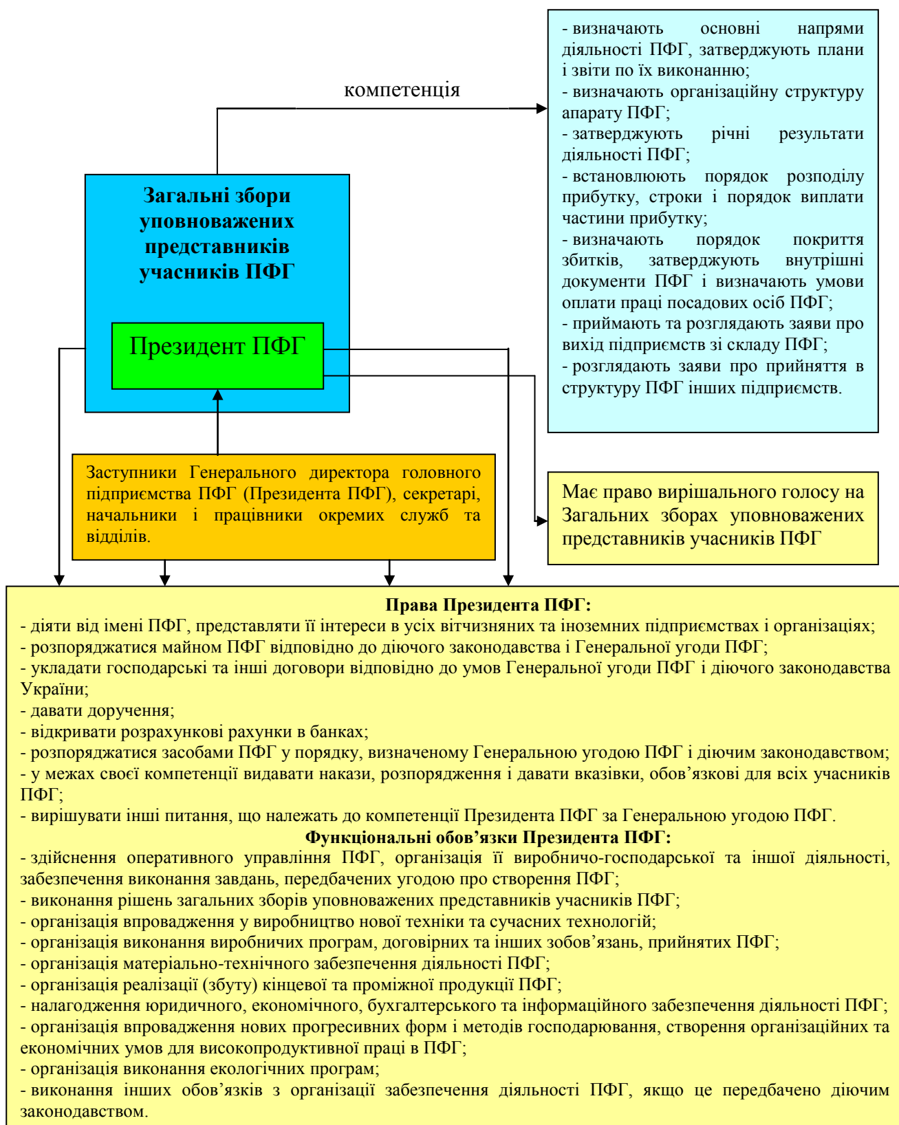
Рис. 2.1. Структура управління ПФГ «Титан»